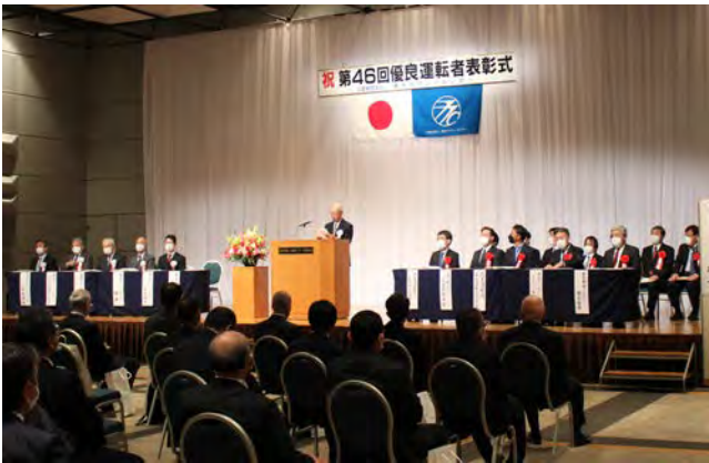
外国人旅客接客研修