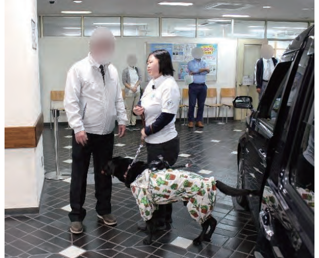
ユニバーサルドライバー研修