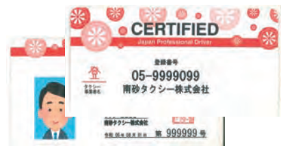
運転者証(法人タクシー)