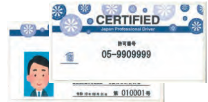
事業者乗務証(個人タクシー)