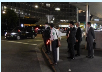
銀座・新橋地区パトロールの状況

合同街頭指導には、同協会所属街頭指導会議議員4名が出動し、土橋ランプ際の際の他、銀座乗禁地区内のパトロールを行いました。当日は、土橋ランプ際に乗り場を無視して客待ち駐車する不適正営業車両は見られませんでした。乗禁地区営業2件、進入禁止無視1件を現認し是正指導しました。運転者の皆様におかれましては適正営業に努めるようお願いいたします。