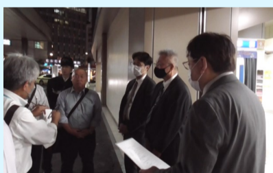
新橋駅前前優良タクシー乗り場集合場所