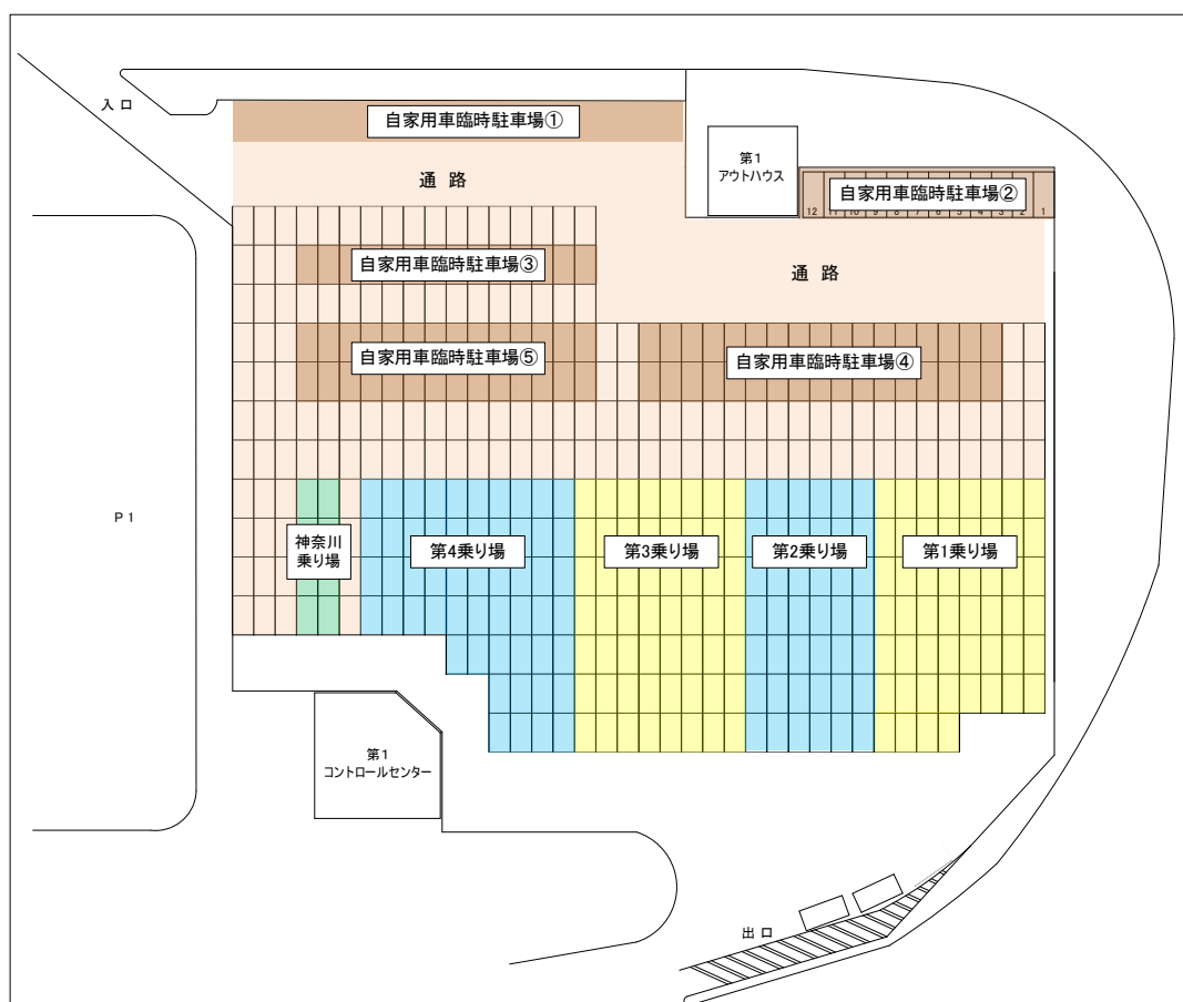
図1 第1 タクシー待機所